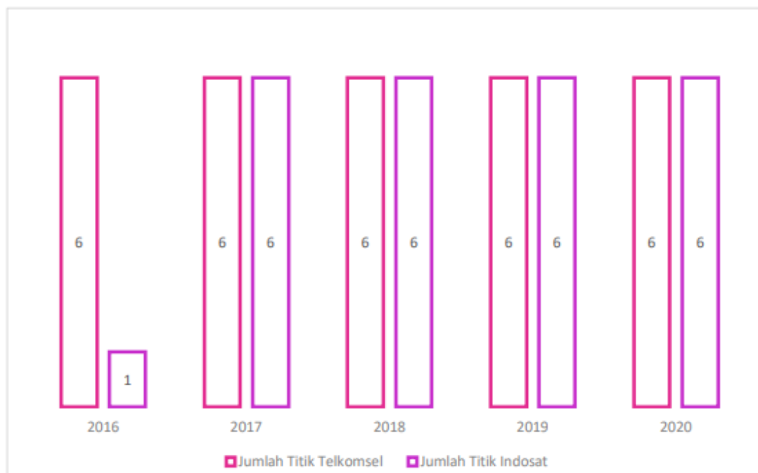
Gambar 21.1 Jumlah Titik Jaringan Terpasang Komunikasi Seluler Di Kabupaten Boven Digoel, Tahun 2016-2020

Sumber : Dinas Komunikasi dan Informatika Kabupaten Boven Digoel, 2021